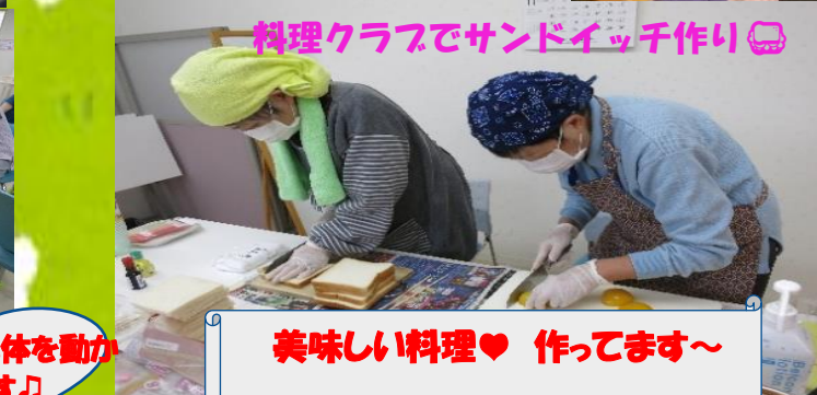
料理クラブでサンドイッチ作り