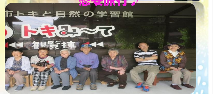
市トキと自然の学習館