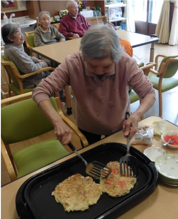
一番の見せ場です！お見事！