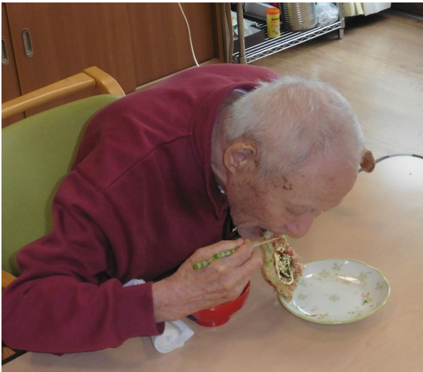
お好み焼きは久しぶりだな～