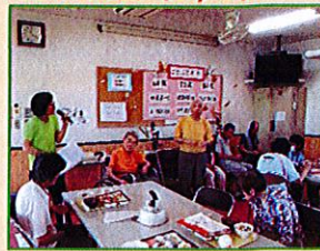
老成円熟。今年は5名の方が還暦、古希、傘寿を迎えられました！