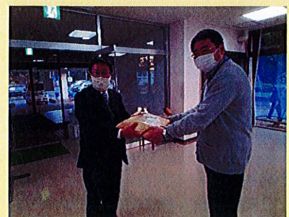
11/17 小国小学校様、小国中学校様 雑巾寄贈