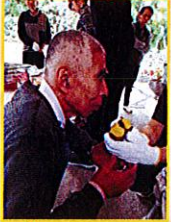
なんといっても秋は炭火の「焼き芋」！