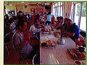
老成円熟。今年は5名の方が還暦、古希、傘寿を迎えられました！