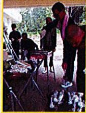
なんといっても秋は炭火の「焼き芋」！