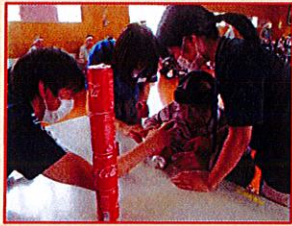
紅白対抗レク大会！空き缶積みと玉入れ競技で大興奮！