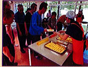
人気のおやつ♪「ちきれない」はクレープ作り！