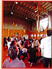
紅白対抗レク大会！空き缶積みと玉入れ競技で大興奮！