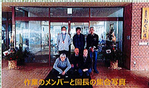
作業のメンバーと園長の集合写真

新年を迎えるにあたり、利用者と一緒に、自前で門松を作りました。今年も健康で穏やかな年となりますように・・・。