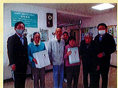
12/25 小国商工会様 加湿器、DVD プレイヤー寄贈