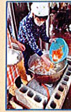
晝画通りに、美味しい豚汁「ごちそうさま」