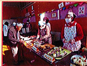
なんといっても、おくに荘の秋はこの行事！！