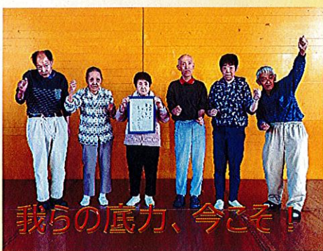
我らの底力、今こそ！