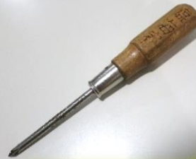
“臨海寮”の焼印があります