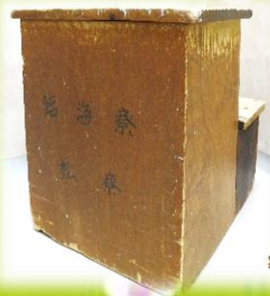
“臨海寮 松寮”とあります