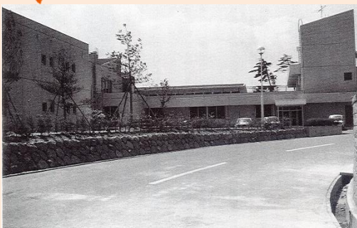
完成したばかりの御山荘(昭和51年頃?)